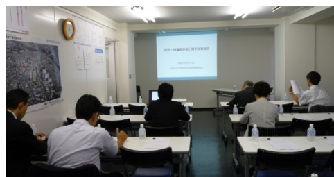
評価・補償基準等勉強会の様子

コンサルタントから、これらが権利変換や補償の基本ルールとなること、また当地区独自のルールとして、①延べ面積500㎡以下の建物の資産評価に補正率を適用する、②前倒しで借家人が転出する場合の「家賃欠収」を補償の対象とすることなどが説明されました。