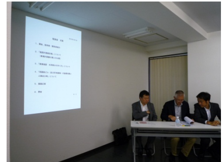
商業床に関する勉強会の様子