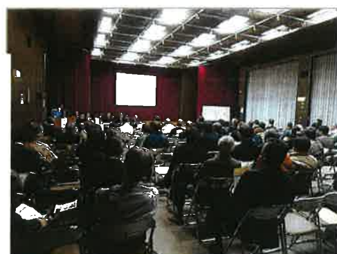
両日とも多数の方にご出席いただきました