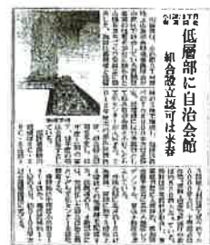
1月31日付新聞に掲載されました

今後は、古くからの街のにぎわいの中心地であるという地域特性を踏まえ、賑わいを受け継ぎ充実させる施設計画をより具体的に検討してまいります。